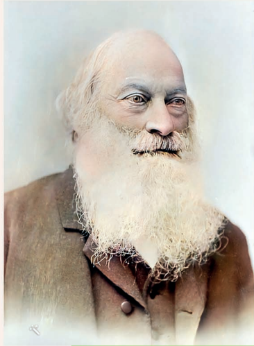
Der Gründer der Diakonie Auerbach